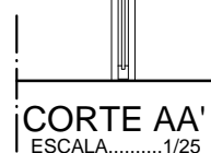
CORTE AA' ESCALA.....1/25